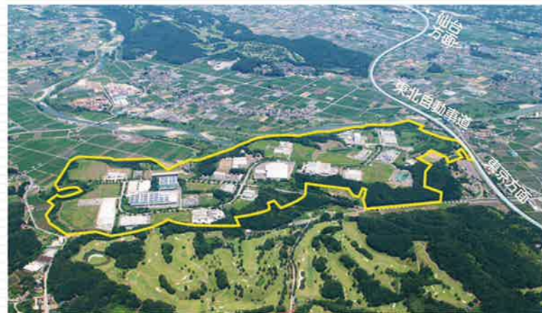
●宇都宮西中核工業団地

《実績》北関東自動車道、国道119号(宇都宮北道路)、 ながわ水遊園、とちぎ海浜自然の家、 宇都宮北高校