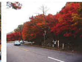
●日塩もみじライン(秋)