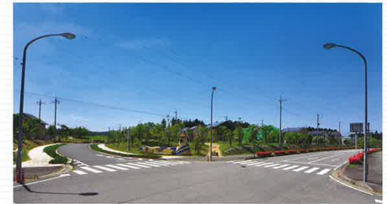
●つつじが丘ニュータウン