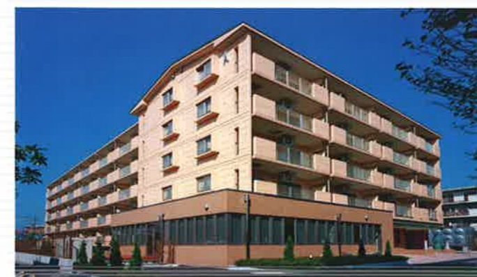
●マロニエハイツ陽北A棟