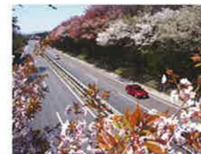
●日光宇都宮道路(春)