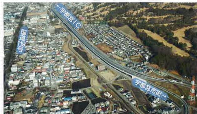
●国道119号宇都宮北道路