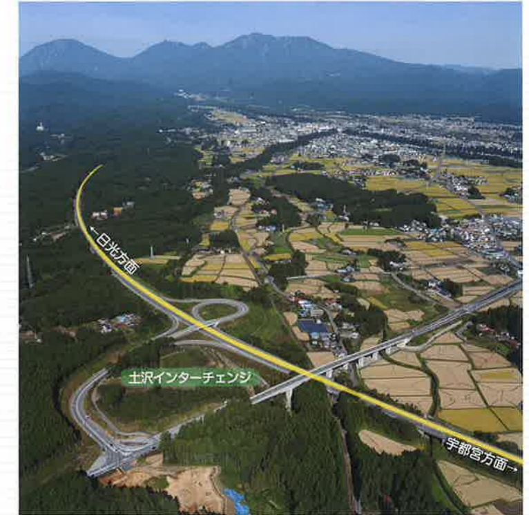
●日光宇都宮道路と土沢インターチェンジ