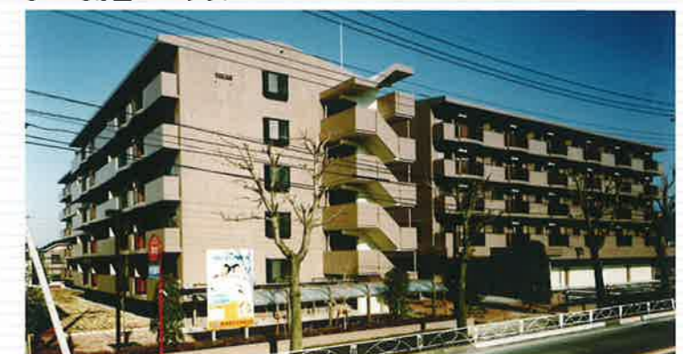
●マロニエハイツ今泉