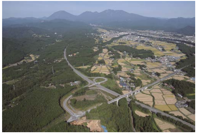
日光宇都宮道路と土沢インターチェンジ