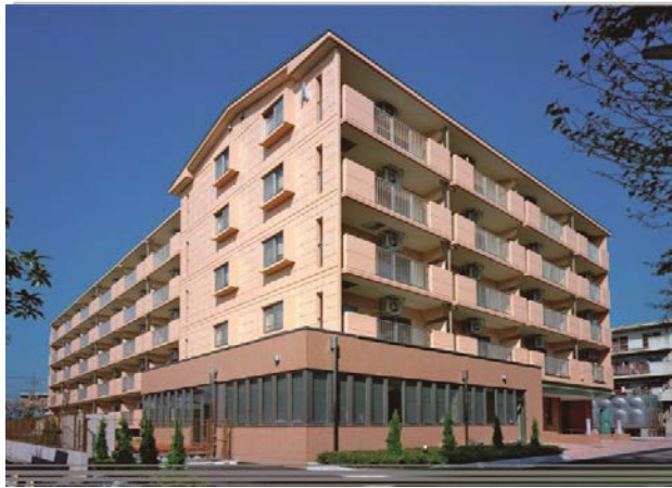
マロニエハイツ陽北A棟