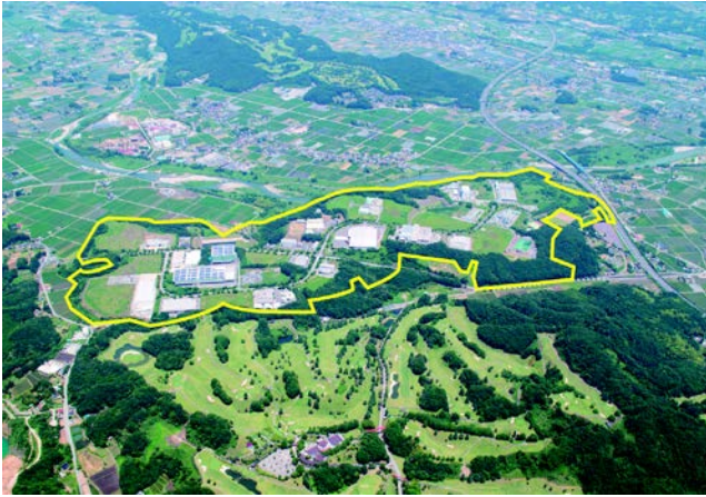
宇都宮西中核工業団地